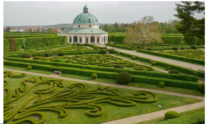
Zabytkowy ogród w Kromieryżu