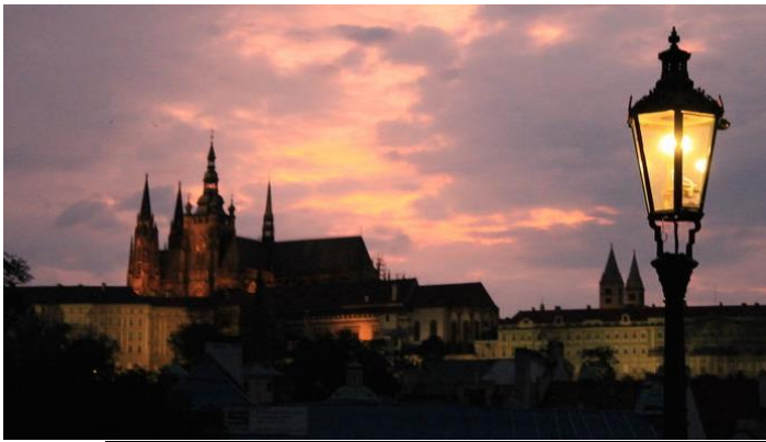
Wzgórze Zamkowe (Hradczany) w Pradze

Nasi południowi sąsiedzi należą do chętnie odwiedzanych państw. Popularnością cieszy się Praga oraz czeskie góry z malowniczymi skalnymi miastami. Do atrakcji Czech zaliczają się również historyczne zespoły miejskie, wspaniałe zamki, a także liczne zabytki architektury oraz techniki (15 wpisów na liście światowego dziedzictwa kulturowego UNESCO!).